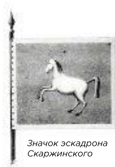
Значок эскадрона Скаржинского